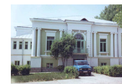
Laboratoarele de instruire practică