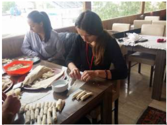
Pregătind Sığara böreği

Mulțumesc Erasmus+ pentru această experiență unică!